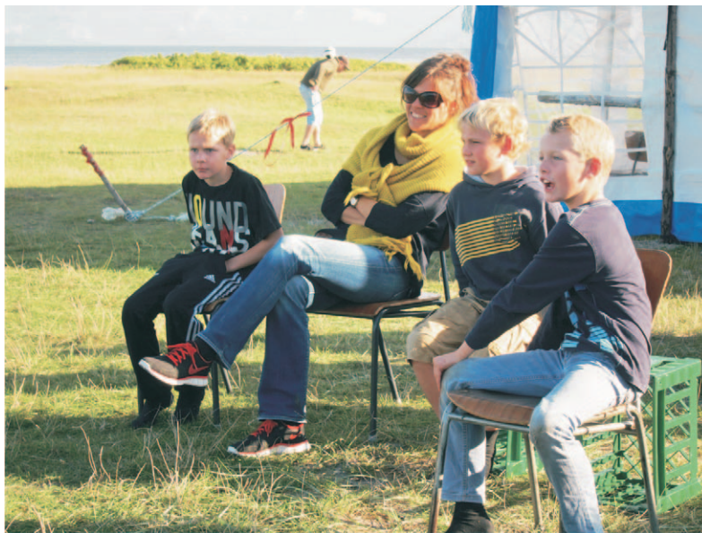
Fælles lejr tur til Bogensholm, august 2011.