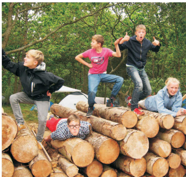
Fælles lejrtur til Bogensholm, august 2011.

- er det nye i vores model. Etikken er "anerkendelsens mor", og derfor har vi valgt tre etiske principper, som vi synes står særlig centralt i vores daglige arbejde og i det hele taget i arbejdet med mennesker og anerkendelse. Disse tre principper er også tre grundlæggende værdier, som vi ønsker skal være et stærkt, fagligt fundament i vores arbejde med børn og forældre. De etiske principper er hentet fra konsulentvirksomheden Etikos ( www.etikos.dk ), der netop beskæftiger sig med udviklingen af den etiske kvalitet og etik i organisationer.