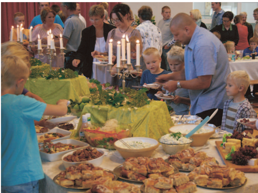
Godt 300 mennesker fra skolen, fra andre fynske friskoler, fra friskoleforeningen og samarbejdspartnere var mødt op. Og mad var der til alle.

gang som skoleleder efter 21 år. Taknemmeligheden over indsatsen var markant – og kom til udtryk hos både børn og voksne.