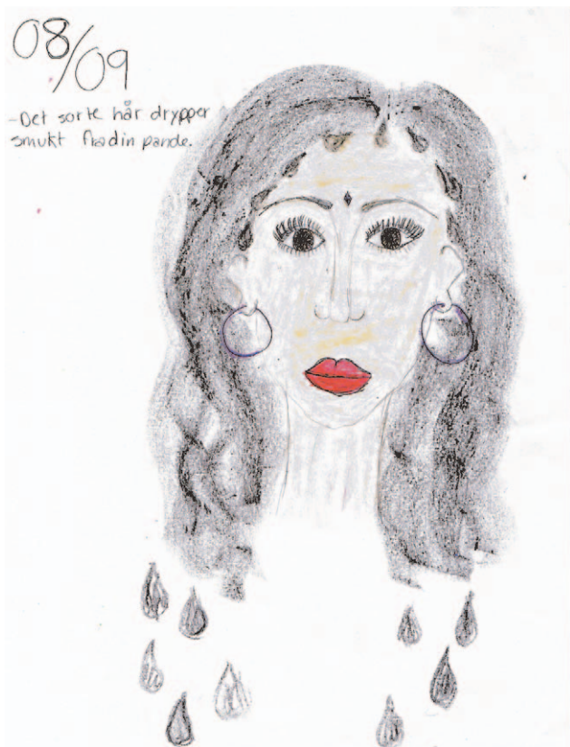
Til Nashet, vers to: Min elskede – snus til min afghanjakke/broderet med isblomster fra gylhanna/når vi har grinet – så skal vi snakke/dit sorte hår drypper smukt fra din pande.

Et stadig spillevende band kan sandelig også udfordre eleverne, såvel poetisk, sprogligt som holdningsmæssigt. Det er TV2. De mestrer i et mere nutidigt (tone)sprogkunsten og jonglerer med ordene. Således i den underfundige "Kom lad os brokke os". Heri bliver et forventet rim til noget helt andet.