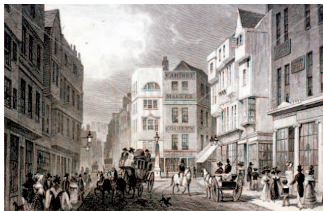
London omkring 1830.

Den bibelsk-kristelige kulturkamp kulminerer i 1825 med Kirkens Gjenmæle, som også rummede en omfattende kritik af den førende statskirkelige teolog, professor H.N. Clausen. Kritikken medførte en injuriersag anlagt af professor Clausen, hvor Grundtvig året efter idømmes livslang censur. Censuren får – sammen med den teologiske afklaring – vidtrækkende følger for Grundtvigs virke, og han bliver særdeles indædt i sin kamp for mere frihed til folket – i skolen, kirken og samfundet generelt.