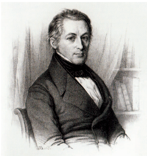
Hans Nicolai Clausen.

Efter sin åndelige vækkelse i 1810 påbegynder Grundtvig en bibelsk-kristelig kulturkamp, som har til formål at påvirke samfundets udvikling, bevæge vennerne til omvendelse, anvende historien til et opgør med kristendommens fjender, samt kritisere rationalismens indflydelse på teologien i den evangelisk-lutherske statskirke.