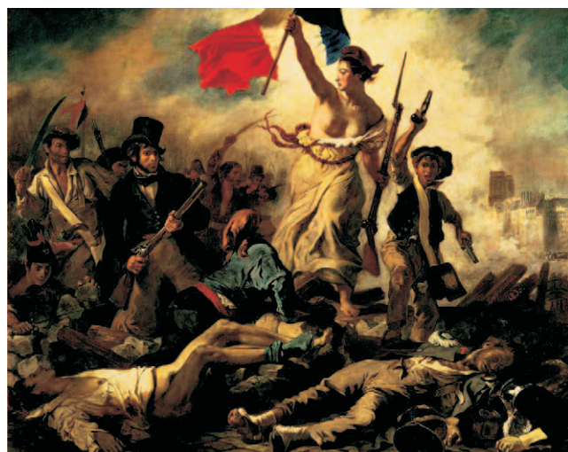
Eugène Delacroix: Friheden anfører folket La liberté guidant le peuple (1830).

Grundtvigs frihedssyn udvikler sig fra 1825 og frem til 1834. Grundtvig erfarer under tre Englandsrejser omkring 1830, at friheden duer til alt godt, og frihedssynet bliver gradvist mere rummeligt. Særligt tanken om, at friheden må være forpligtet på næsten – inspireret af Luthers tanke om, at et kristent menneske er en fri herre over alle ting og ikke underlagt nogen. Men at et kristent menneske samtidig er en træl, der tjener alle ting og er underlagt enhver – vokser sig større hos Grundtvig. Rummeligheden og forpligtelsen går hånd i hånd.